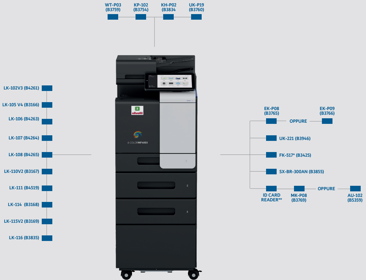
d-Color MF3303 (B3741) d-Color MF4003 (B3742)